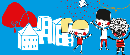
Imagen colectiva de Parla y Discursos de la prensa sobre la infancia y la adolescencia en Parla

El análisis de la inseguridad en Parla requiere estudios que no se limiten a exponer los casos de crímenes violentos y reforzar el estigma general. Por el contrario, hace falta una visión integral de la ciudad y de lo que hace que un entorno sea seguro y saludable, diferenciando qué y cómo causa inseguridad, así como los elementos en positivo que aportan vitalidad y bienestar. Cabe destacar que la percepción de inseguridad en Parla tiene un gran componente subjetivo, puesto que los datos objetivos señalan que se sitúa por debajo de la media de la Comunidad de Madrid en índice de criminalidad.